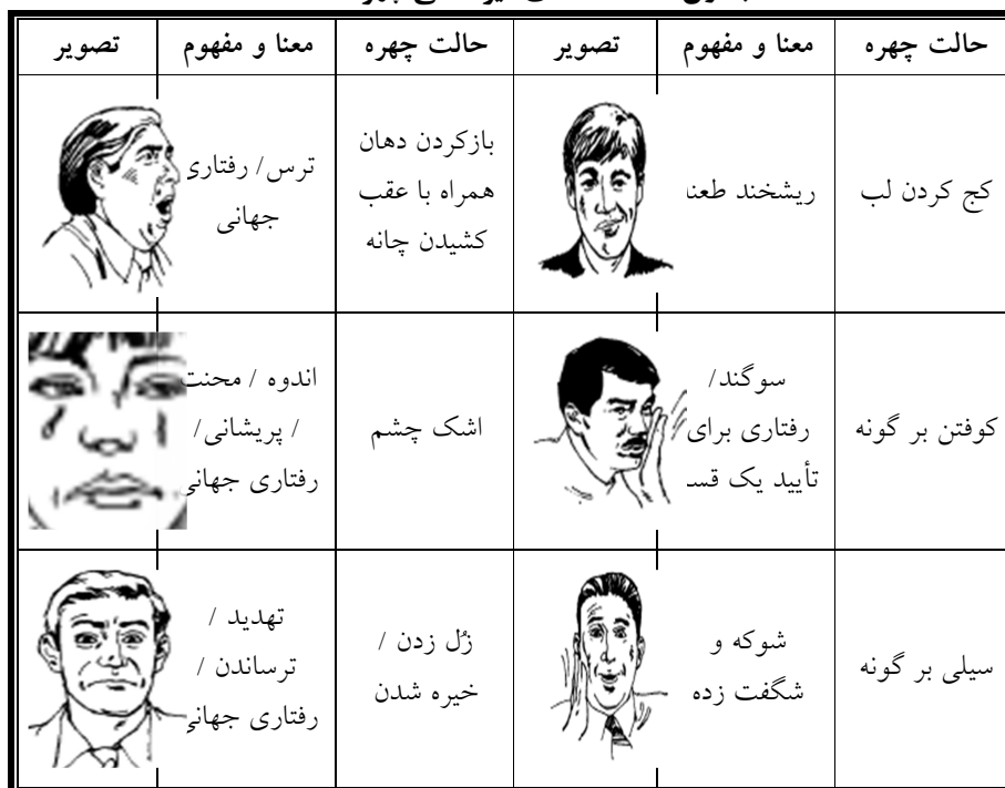
جدول ۱: دلالت‌های غیر کلامی چهره

بر این مبنا روشی جهت ارزیابی عواطف چهره‌ای نیز پیشنهاد شده است که از آن به اختصار تحت عنوان (FAST) ۱۳ نام برده می‌شود. برای نمونه به راین مبنا غم و ترس در ناحیه چشم‌ها و پلک‌ها به بهترین شکل و تا حد ۶۷٪ قابل تشخیص است؛ در حالی که خشم در ابروها، دهان، گونه‌ها و پیشانی بروز داده می‌شود و شگفتی در هر سه ناحیه قابل رؤیت است. (ریچموند، مک کروسکی، ۱۳۸۸، صص ۲۰۷-۲۰۶) با توجه به نکات گفته شده درباره‌ی دلالت‌های غیر کلامی چهره، نکات بسیاری گفته شده است که به صورت اجمالی می‌توان آن‌ها را جدول زیر را ارائه داد. (Morris, 1994, p. 4)