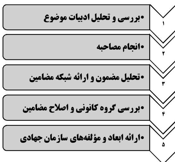
شکل ۱. فرآیند پژوهش

تجزیه و تحلیل قرار گرفته است. در وهله نخست کدگذاری باز انجام گرفت، سپس از کنار هم قرار دادن کدهای اولیه مفاهیم ساخته شد و مقوله‌ها نیز از ربطدهی مفاهیم صورت گرفتند. ابتدا مضامین اولیه استخراج شد و برای مصاحبه‌شوندگان ارسال گردید و نظرات اصلاحی آنان اعمال گردید و در مرحله بعد در جلسه گروه کانونی که با حضور تعدادی از مصاحبه‌شوندگان و تعدادی از اساتید دانشگاه مورد اعتبارسنجی و تأیید قرار گرفت. این فرآیند به صورت مختصر در شکل شماره ۱ قابل مشاهده خواهد بود.