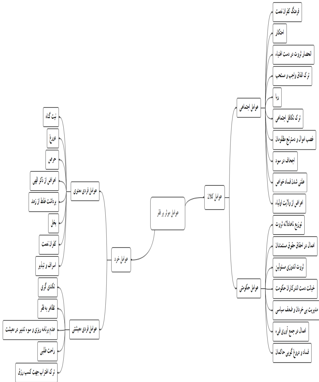
شکل شماره ۲: شبکه مضامین عوامل مؤثر بر ایجاد فقر در جامعه اسلامی از منظر آیات قرآن و روایات اهل بیت (ع)