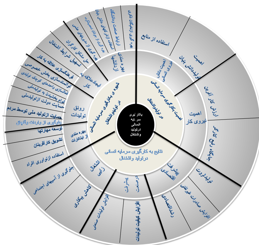
شکل (۳): مدل جایگاه سرمایه انسانی در تولید و اشتغال از دیدگاه مقام معظم رهبری

با توجه به مؤلفه‌های استخراج‌شده شکل (۳) طراحی گردید.