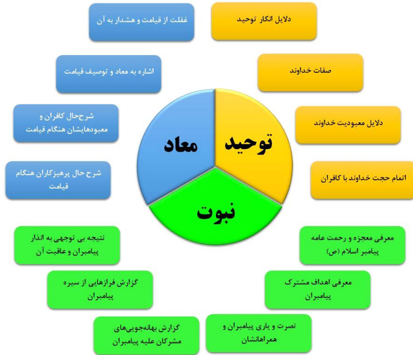
شکل (۲): شبکه مضامین مرتبط و بهم‌پیوسته سوره انبیاء